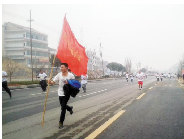
红旗飘飘，万人随我行