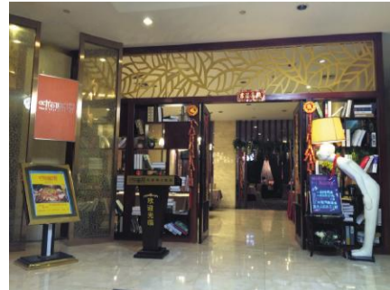
黄金海岸时间新语

企业文化精神,着力打造“星级服务、平民消费”的长沙城北家居后花园。 顺天黄金海岸大酒店连续 4 年被评为长沙市十佳四星级饭店、长沙市旅游行业培训工作先进单位、长沙市卫生文明单位。酒店集餐饮、客房、宴会、会议于一体。拥有多种类型客房 145 间(套),房间宽敞舒适,完善独特的客房设施,热情周到的体贴服务,为您带来高品质的入住体验。由 20 余个豪华餐饮包厢组成的“黄金食代”,让您在宴请接待时既能品尝到美味可口的佳肴,全程跟踪的 VIP 管家式服务和一站式服务更能将您获得宾至如归的至尊感受。2014 年底重磅推出的“开动吧”肥牛海鲜火锅城,采用新鲜、内蒙古生态肥牛、羊肉、顺天蔬菜基地有机产品为火锅主打产品,将为您带来全新的味觉惊喜。2014 年 11 月开业的“时间新语”中西餐厅,主打亲民路线,让您在用餐之余感受不一样的浪漫与温馨。另有咖啡厅、影视厅、棋牌等丰富您的业余生活。酒店还拥有能同时容纳 600 人的大型会议室及 10-100 人的小型会议室,并能同时供 500 人使用的大型宴会厅。良好的地理位置、舒适的酒店环境、严谨科学的管理、细致周到的个性服务是您商务、会议、休闲、娱乐的最佳选择。我们将以“唯美至真、唯真至善”的服务宗旨,令您的商旅之行称心如意。