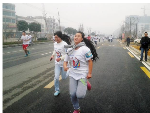
我们踏在平整康庄的蔡锷大道上，幸福向前冲