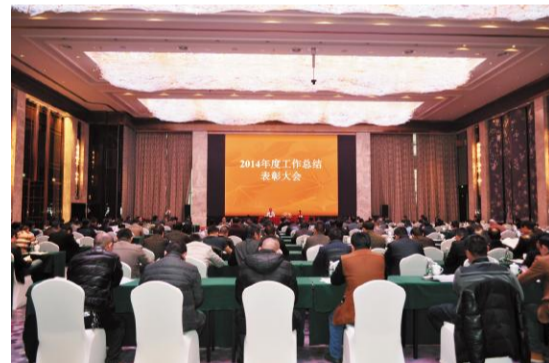
顺天建设2014年度工作总结表彰大会会场全景