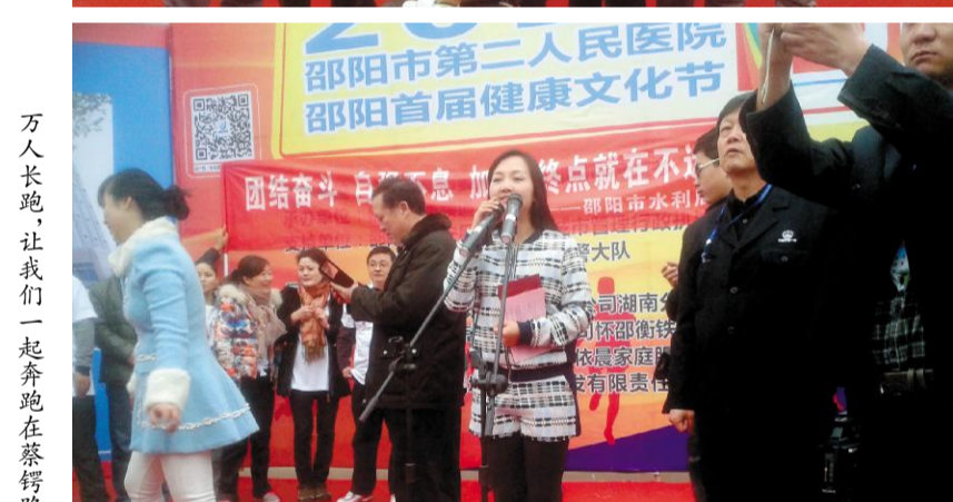
万人长跑，让我们一起奔跑在蔡锷路上