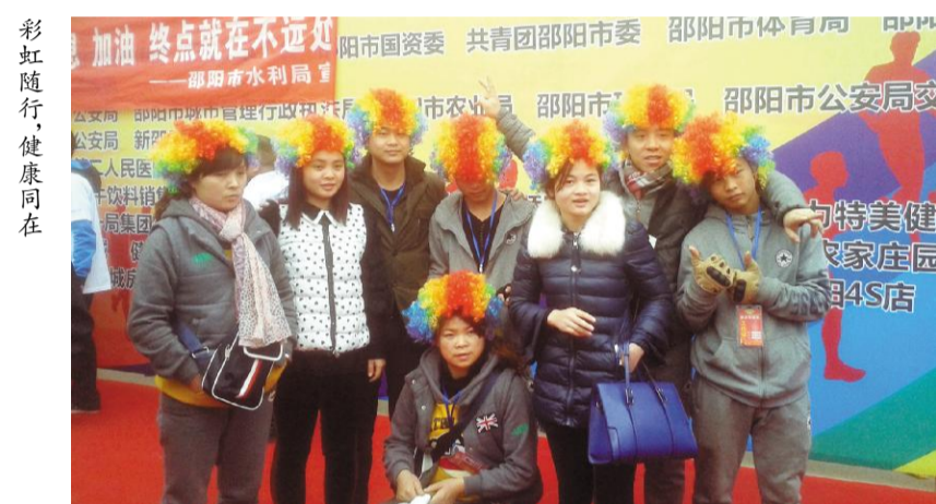
彩虹随行，健康同在